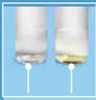
Agua Hidrogenada Aguade la llave

El Q-Mist genera una alta concentración de hidrógeno (hasta 800 ppb) y un POR (Potencial de Óxido Reducción) negativo (hasta -400 mV). El agua hidrogenada neutraliza los radicales libres y rejuvenece la piel, además de proveer un efecto anti-inflamaciUn para reducir el acné y mejorar la salud de la piel.