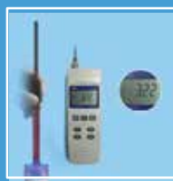
Potencial de óxido reducción hasta de -400