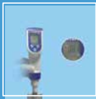
Concentración de hidrógeno hasta de 800 ppb